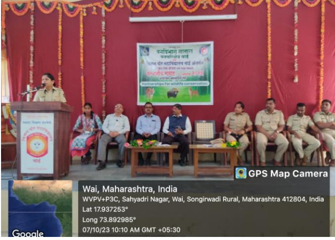
Wai, Maharashtra, India WVPV+P3C, Sahyadri Nagar, Wai, Songirwadi Rural, Maharashtra 412804, India Lat 17.937253° Long 73.892985° 07/10/23 10:10 AM GMT +05:30